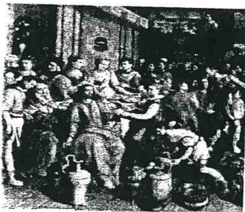
( Le nozze di cana )